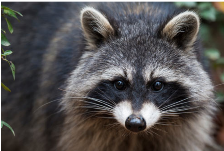
Immer mehr Waschbären leben in deutschen Revieren.